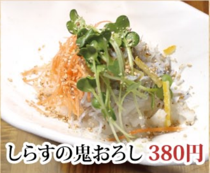
しらすの鬼おろし 380円