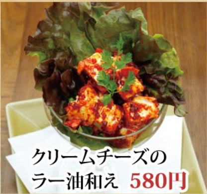
クリームチーズの ラー油和え 580円