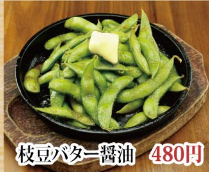
枝豆バター醤油 480円