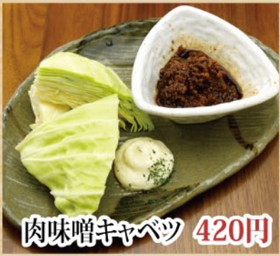
肉味噌キャベツ 420円