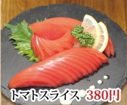
トマトスライス 380円