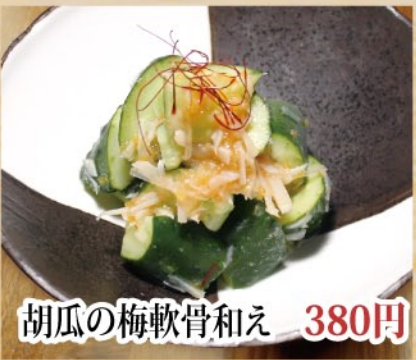
胡瓜の梅軟骨和え 380円