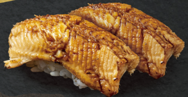
煮穴子握り 2貫 ¥400