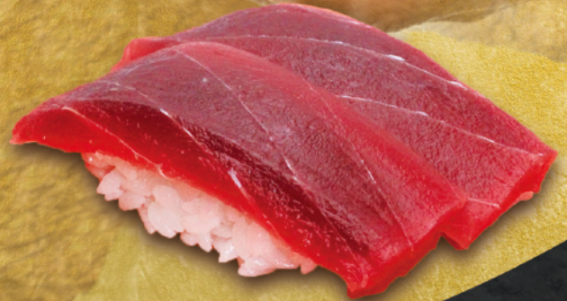
マグロ赤身握り 2貫 時価