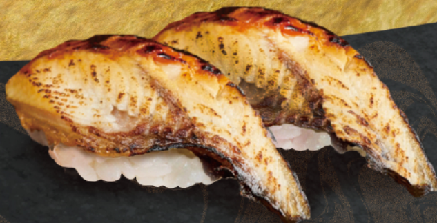
うなぎ握り 2貫 ¥600