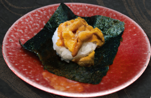
うに 海苔包み 時価