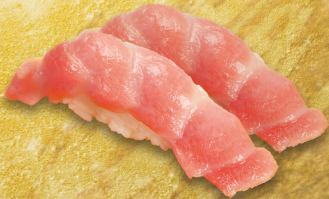
マグロトロ握り 2貫 時価