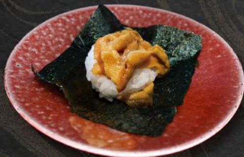
うに 海苔包み 時価