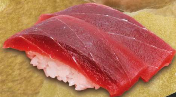
マグロ赤身握り 2貫 時価