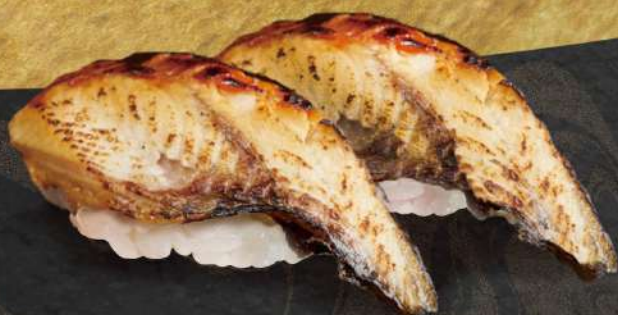
うなぎ握り 2貫 ¥600