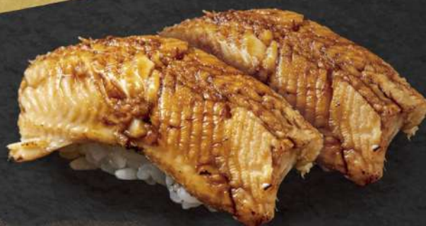
煮穴子握り 2貫 ¥600