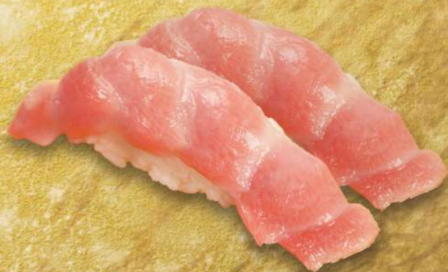
マグロトロ握り 2貫 時価