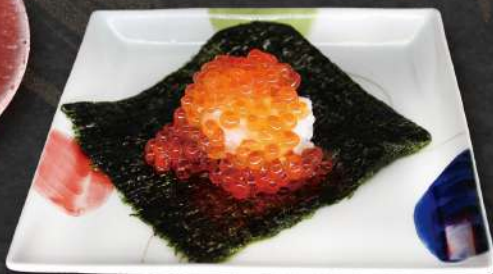
イクラ 海苔つつみ ¥600